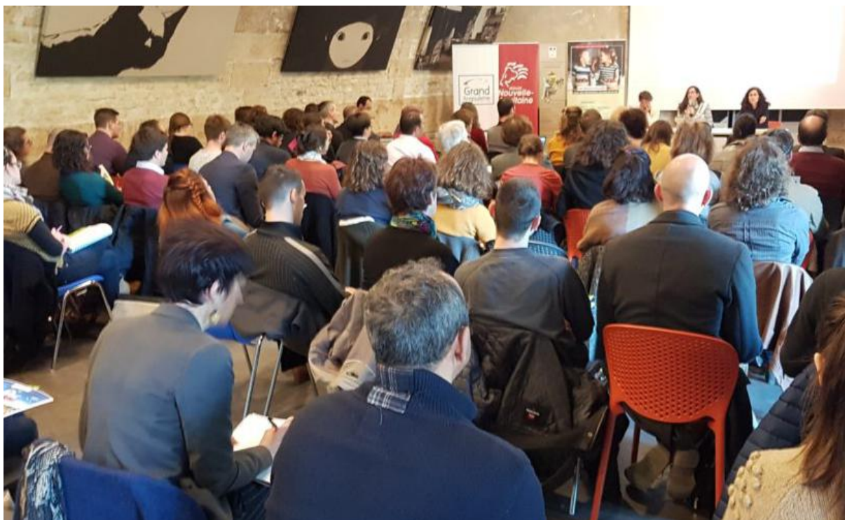
80 participants à la rencontre nord du 4 avril à Angoulême ayant pour thème l'approche territoriale de l'agriculture et de l'alimentation