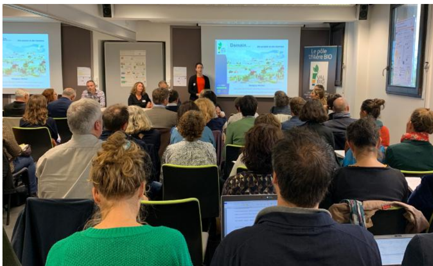
90 participants à la rencontre « nord » du 17 octobre à St Jean d'Angély ayant pour thème « Filières alimentaires et économie du territoire »

- En Nouvelle-Aquitaine, on dénombre 15 Projets Alimentaires de Territoire donnant un cadre stratégique et opérationnel à des actions partenariales répondant à des enjeux sociaux, environnementaux, économiques et de santé et où l'alimentation devient un axe intégrateur et structurant de mise en cohérence des politiques sectorielles sur le territoire. Trois d'entre eux ont d'ores et déjà été labellisés par le Ministère de l'Agriculture et 5 sont en cours de labellisation. A cela s'ajoute une vingtaine de projets en émergence et une cinquantaine sur les circuits alimentaires locaux dont une forte majorité aborde l'approvisionnement local de la restauration collective.